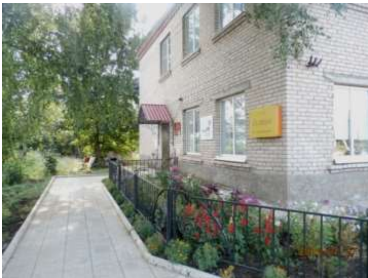
Гурт Администрация библиотека юрт