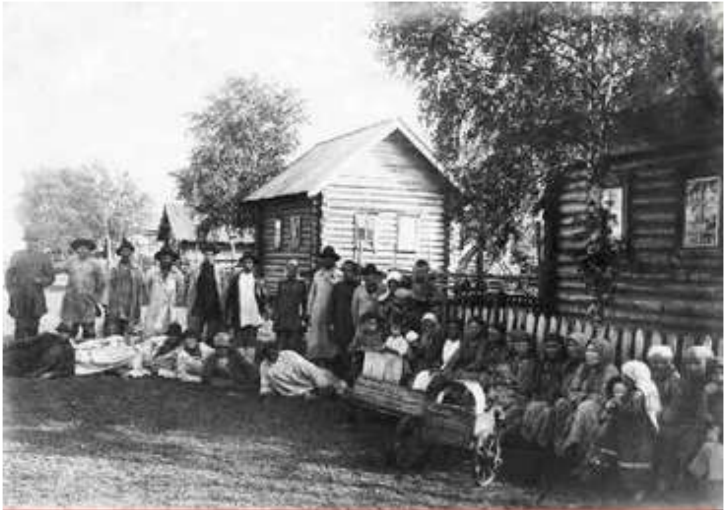
Жители деревни Нижние Юри. ВАО, Малопургинский район, д. Нижние Юри, 1930 г.