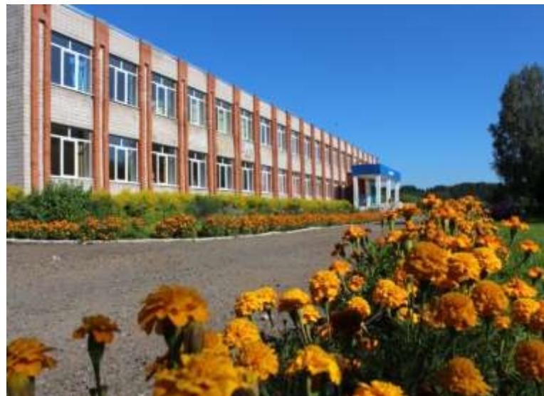
МОУ СОШ д. Нижние Юри Юрт 1989 арын усьтэмын