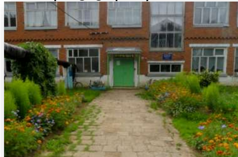
МДОУ «Чингыли» Юрт 1983 году усьтэмын